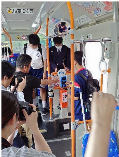
《バス乗り方教室の様子》