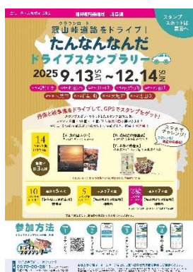
《R7 ドライブスタンプラリーチラシ》

冠山峠道路開通を機にスタートした丹南地域と岐阜県西部をつなぐドライブスタンプラリーは、新たに生まれた人流が途絶えないよう、周知徹底の上、継続します。また、観光産業施設での体験とセットにするなど、丹南地域での周遊滞在を促す仕掛けをするとともに、スタンプラリー参加者の居住地・人気スポットなどの傾向を分析し、次の観光戦略に活かしていきます。