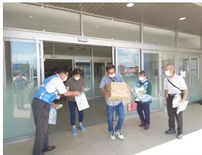
《非行防止一斉キャンペーン》