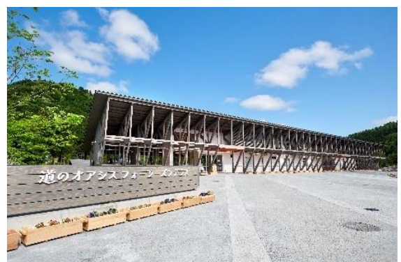
《フォーシーズンテラス（池田町）》