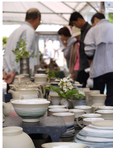
《越前陶芸まつり（越前町）》