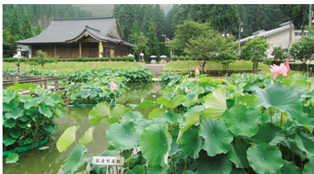
《花はす公園（南越前町）》