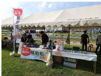
《観光イベントへの出展》

福井県のやまぎわに点在する「天下一」といえる8つの地域資源（越前打刃物、越前和紙、越前漆器、一乗谷朝倉氏遺跡、大本山永平寺、福井県立恐竜博物館、平泉寺白山神社、越前おおの）を巡るルートを設定し、ふくいやまぎわ天下一街道という「天下一」の地域資源を軸とした観光ルートを確立させ、県内外からの誘客促進、滞在型観光客の拡大を図ることを目的とした団体